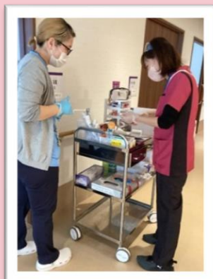
特別養護老人ホーム『えんゆうの郷』