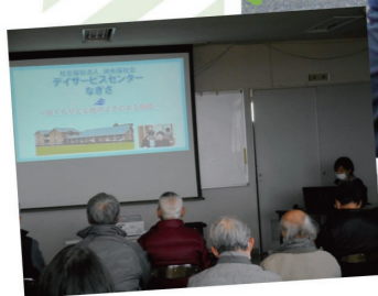
※昨年の医療・福祉を考える会の様子